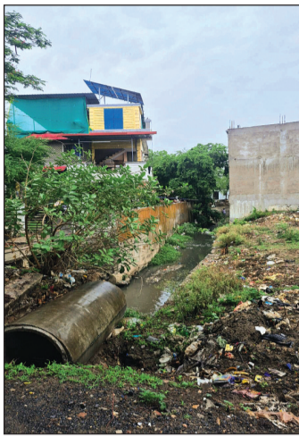
यह निर्माण किसी हादसे को न्यूता दे सकते हैं। अधिकांश मकान अतिक्रमण कर और गलत तरीके से बनाए गए हैं, लेकिन नगरपालिका और राजस्व अमले, दोनों को इस बात की कोई फिक्र नहीं है कि इन्हें रोका जाए।

शहर के अधिकांश नदी-नाले अतिक्रमण की जद में हैं। यहां तक की अतिक्रमणकारियों ने नाले के ऊपर तक अतिक्रमण कर पक्का निर्माण कर लिया है। किसी ने बीम से पिल्लर निर्माण कर खड़ा कर दिया, तो किसी ने दीवार डालकर निर्माण कर रखा है। इसे हटाने के लिए नगरपालिका ने अभी तक कोई ठोस कार्यवाही नहीं की है।